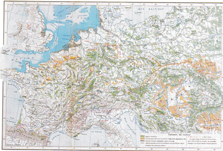
Vidal de la Blache Paul, 1994 [1903], Tableau de la géographie de la France , Paris: Édition de la Table Ronde